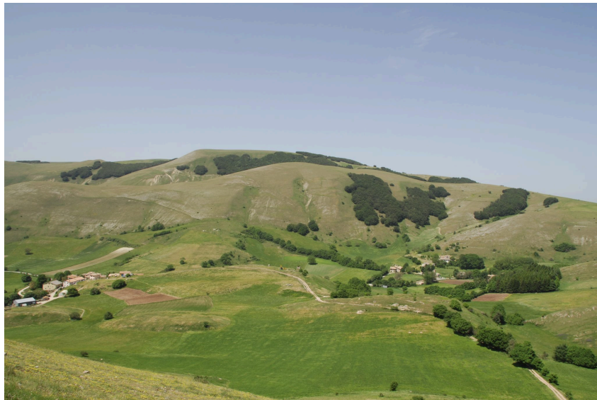
Panorama gent. conc. Comune di Montecavallo.