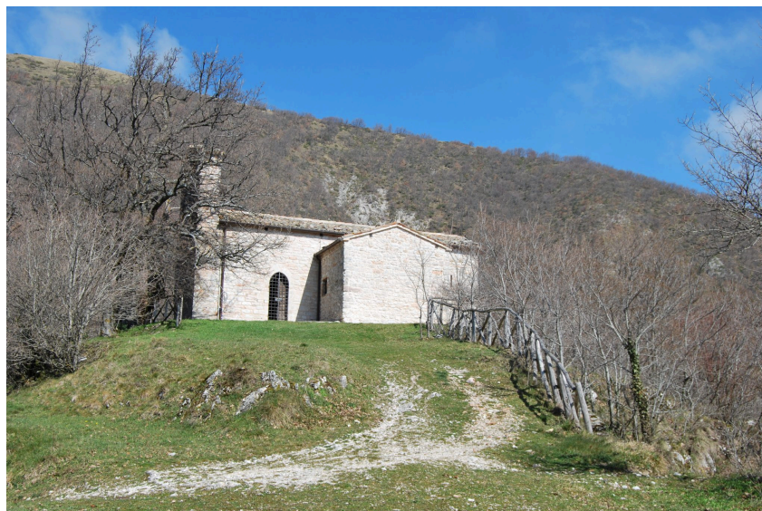
Chiesa di San Niccolò